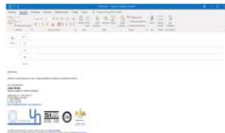
Podpis v e-pošti