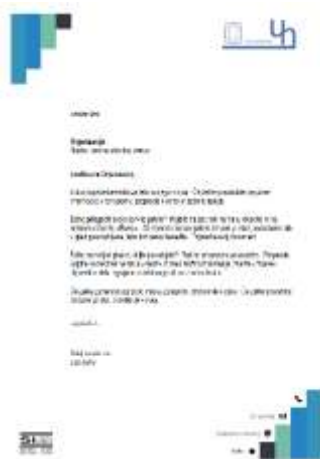
Dopisi in drugi dokumenti